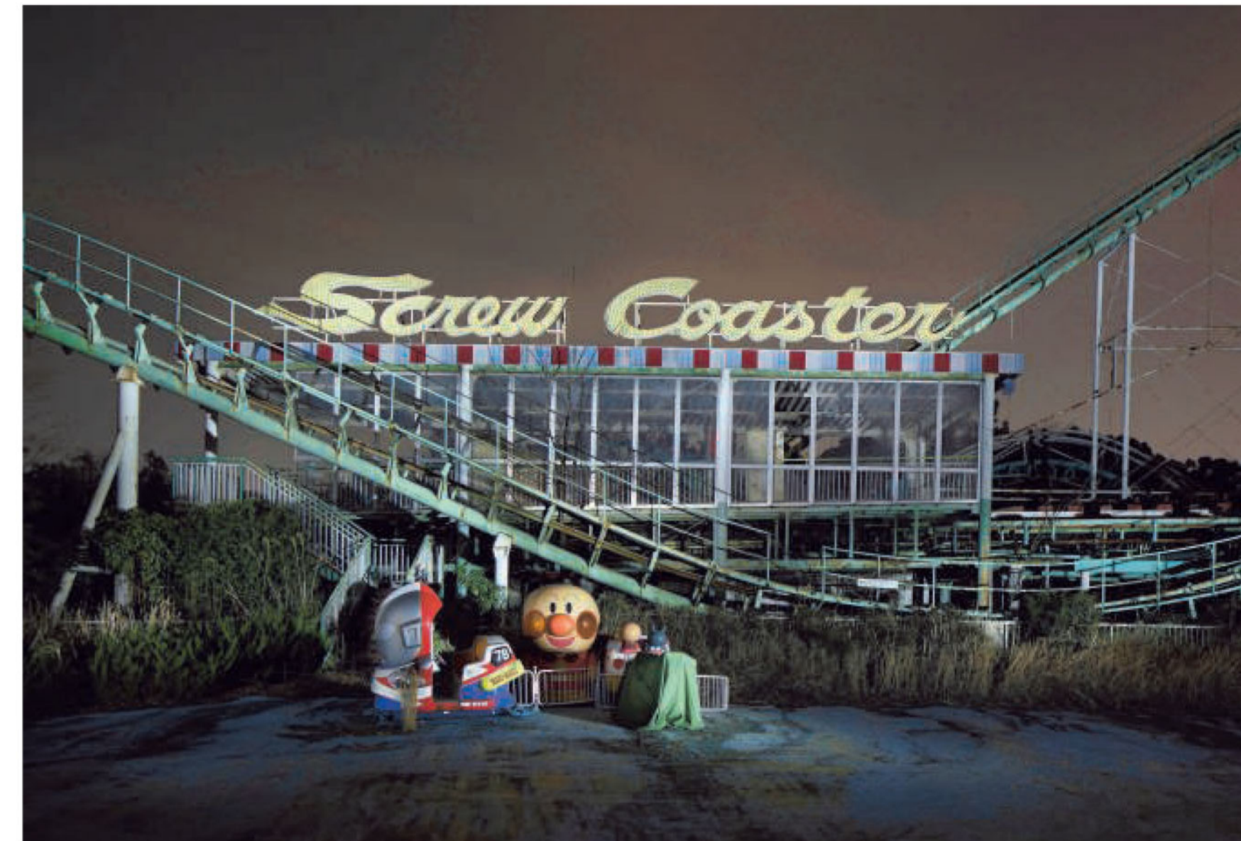
Nara Dreamland, Japan. 'Op het hoogste punt van de rollercoaster, balancerend tussen hoogtevrees en extase, zie ik de bewaker voor de poort staan. Hij ziet me niet. Hij zou nochtans 10.000 yen kunnen verdienen als hij me snapt.'