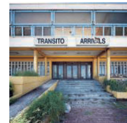
Luchthaven, Cariben. 'In een leegstaande terminal van een nog operationele luchthaven infiltreren is altijd lastig. Toestemming krijgen voor dit soort locaties is al even problematisch. Maar soms staat de deur op een kier.'