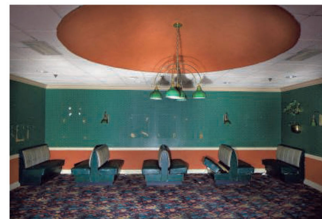
Shoppingmall, VS. 'In de mall heerst een galmende stilte. Er is wat waterschade, maar verder nog geen verval. Met het golfkarretje bij de ingang wordt elke week een ronde door de gebouwen gemaakt.'