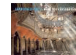
Henk van Rensbergen - Abandoned Places 3 - 2012, Lannoo, 192 blz., 34,99 euro.

De expo 'Abandoned Places' loopt van 30 september tot 4 november in Antwerpen (Quellinstraat 46). Open: vr-za-zo van 13 tot 18u.